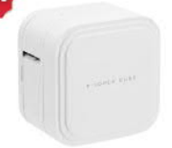
PT-P910BT 手機 / 電腦連線 時尚美型標籤機