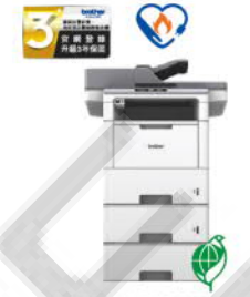
MFC-L6900DW_LT 超高速旗艦級 無線黑白雷射複合機 附雙層擴充紙匣