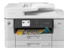
MFC-J3940DW A3 威力印輕連供旗艦版 雙紙匣商用網路傳真事務機