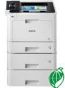
HL-L8360CDW_LT 高速雙面無線彩色雷射 印表機附雙層擴充紙匣