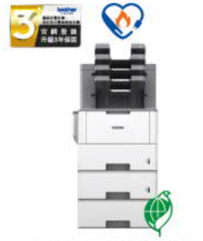
HL-L6400DW_MXL 超高速旗艦級 黑白雷射印表機 附雙層擴充紙匣與分頁器