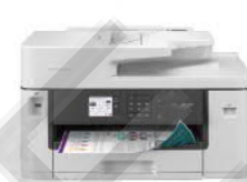
MFC-J2340DW A3 威力印輕連供 商用網路傳真事務機