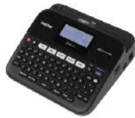
PT-D450 專業型單機 / 電腦連線兩用標籤機