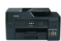
MFC-T4500DW 原廠大連供 A3 多功能複合機