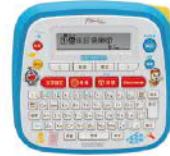
PT-D200DR 哆啦A夢創意自黏標籤機