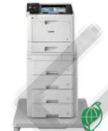
HL-L8360CDW_TT 高速雙面無線彩色雷射 印表機附塔匣