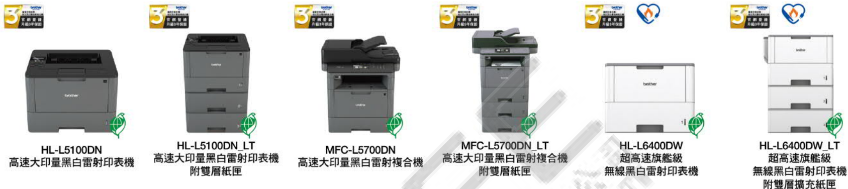
HL-L5100DN 高速大印量黑白雷射印表機