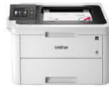
HL-L3270CDW 彩色雙面無線雷射印表機