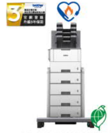
HL-L6400DW_MXT 超高速旗艦級 無線黑白雷射印表機 附塔匣與分頁器