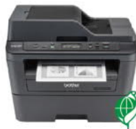
DCP-L2540DW 無線雙面多功能 黑白雷射複合機