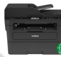
MFC-L2750DW 無線雙面多功能雷射 傳真複合機