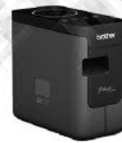
PT-P750W WIFI / NFC 高速無線傳輸標籤列印機