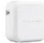
PT-P710BT 手機 / 電腦連線 玩美標籤機