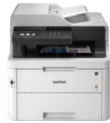
MFC-L3750CDW 彩色雙面無線雷射複合機