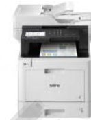
MFC-L8900CDW 尊傲系列高速全能彩色雷射 複合機