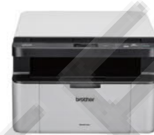
DCP-1610W 無線黑白雷射多功能複合機