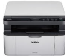
DCP-1510 黑白雷射多功能複合機