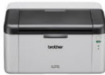
HL-1210W 無線黑白雷射印表機