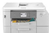
MFC-J4540DW 威力印輕連供商用雙面 網路雙紙匣傳真事務機