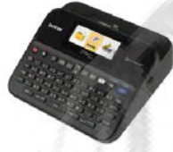
PT-D600 高速彩色螢幕標籤機 單機 / 電腦連線 兩用