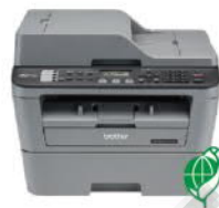
MFC-L2700D 黑白雷射 自動雙面列印複合機