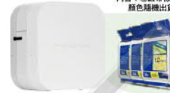
PT-P300BT 藍牙連線 玩美標籤機