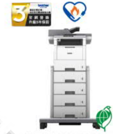
MFC-L6900DW_TT 超高速旗艦級 無線黑白雷射複合機 附塔匣