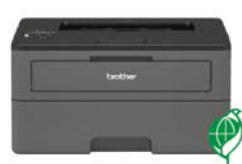
HL-L2375DW 黑白雷射自動雙面印表機