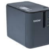
PT-P900W 超高速專業級無線標籤機