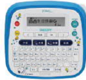
PT-D200SN SNOOPY 創意自黏標籤機