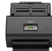
ADS-3600W 專業級高速無線網路掃描器