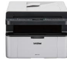
MFC-1910W 無線黑白雷射傳真複合機