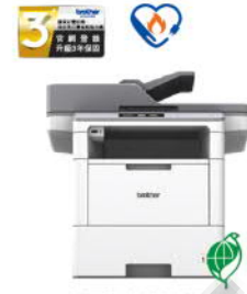
MFC-L6900DW 超高速旗艦級 無線黑白雷射複合機