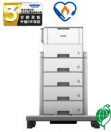
HL-L6400DW_TT 超高速旗艦級 無線黑白雷射印表機 附塔匣