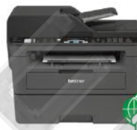
MFC-L2715DW 無線雙面多功能雷射 傳真複合機