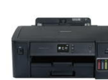
HL-T4000DW 原廠大連供 A3 印表機