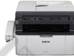
MFC-1815 黑白雷射傳真複合機(附話筒)