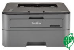
HL-L2320D 黑白雷射自動雙面印表機