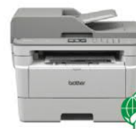
MFC-L2770DW 無線雙面多功能雷射 傳真複合機