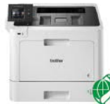
HL-L8360CDW 尊傲系列高速雙面無線 彩色雷射印表機