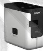
PT-P700 桌上型財產標籤條碼列印機